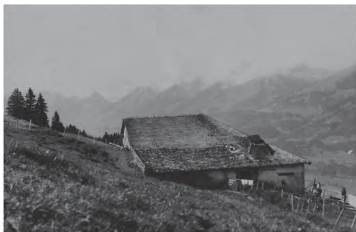
Années soixantes. Le toit de bardeaux est bien entamé. Mon grand-papa, Maurice aux Zombets, taille des piquets alors qu'un de ses petits-fils joue en arrière plan.

15 mai 2023, le Coula a perdu son vieux toit de bardeaux. Il est remplacé par des plaques de tôle ondulée sur lesquelles la rouille dessine son oeuvre abstraite et monochrome.