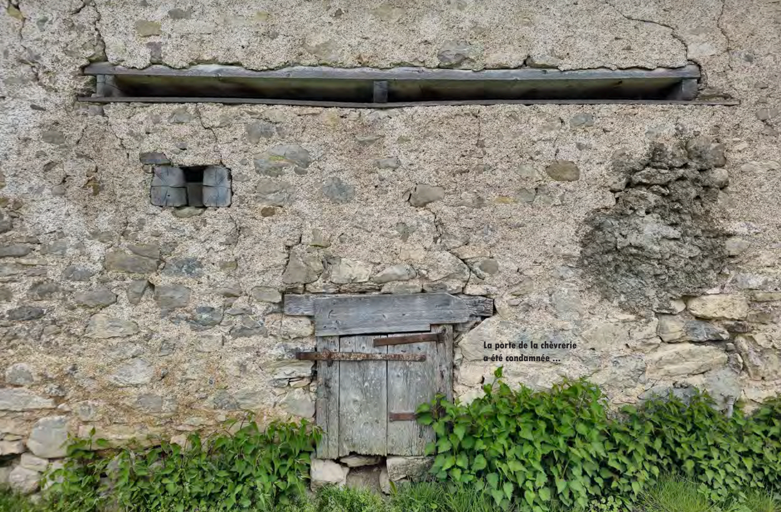
La porte de la chèverrie a été condamnée ...