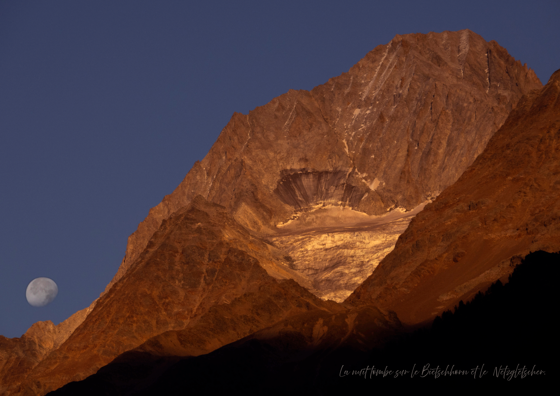
La nuit tombe sur le Bietschhorn et le Nätzgletscher.