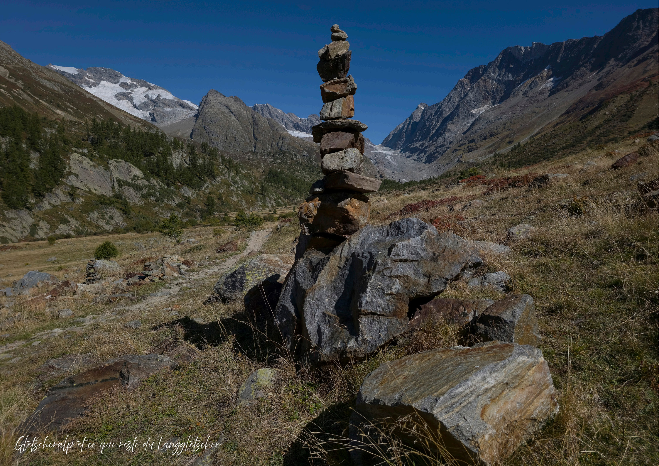
Gletscheralp et ce qui reste du Langgletscher